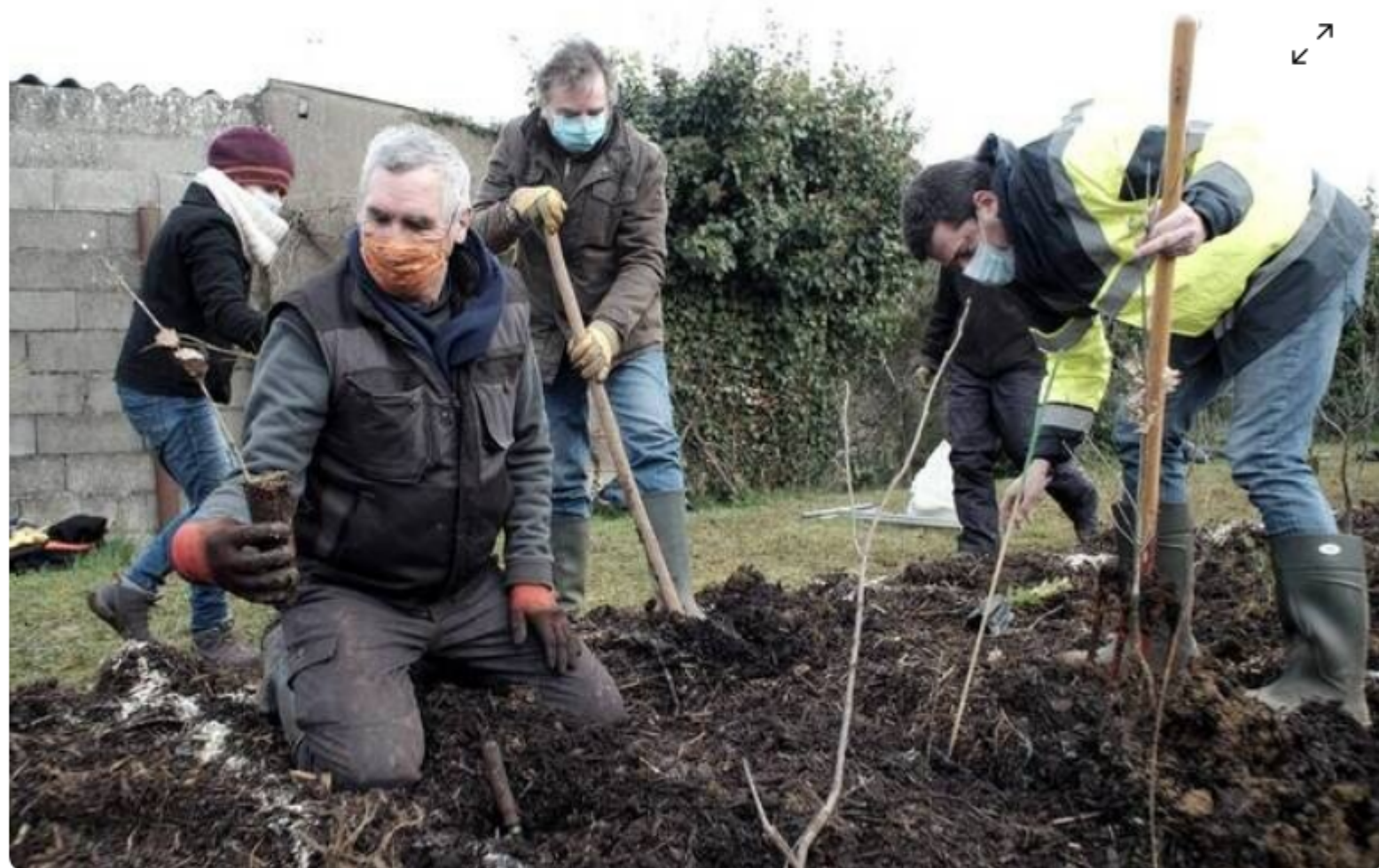
En février 2021, au moment des plantations...

Les micro-forêts à l'épreuve des canicules : « On a eu super peur, mais on a été bluffés »